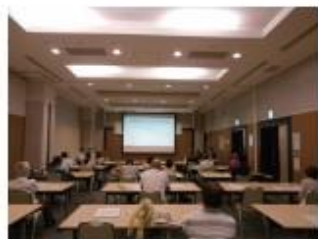
公開セミナーでの講演 (環境カウンセラー登録)