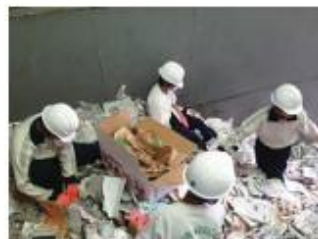
中学生の職場体験学習