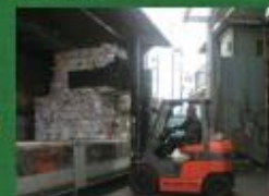
製紙メーカーに出荷され、 再生紙原料になります。