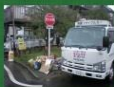
お客様から回収した古紙は