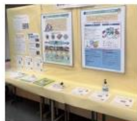
リサイクルイベント における啓蒙活動