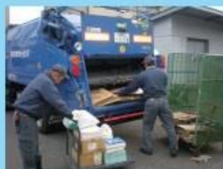
工場・事業所からの段ボールや オフィスミックス古紙の回収

事業所から出る段ボールやコピー用紙、金属類の回収と機密文書の溶解処理、産業廃棄物収集運搬を行っております。回収後の流通経路を明確に表示するため、資源物にはリサイクル化証明書、機密文書処理には溶解証明を発行いたします。