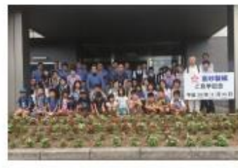
小学生の工場見学