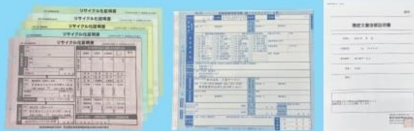
リサイクル化証明書・マニフェスト・機密文書溶解証明の発行