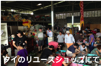
タイのリユースショップにて

ところが、ご家庭からの不用品の回収は一般廃棄物の許可業者しか出来ません。無料回収のトラックも厳密には違法です。そこで、こうしたイベントを通じて回収や、自治会、幼稚園や小学校を通じた持ち込み回収イベントをご提案させて頂いております。回収出来るのは、国内外でリユース可能なもの、まだ使えるものになります。家具などは、搬出と運搬の手数料を頂きますが、リユース可能なものもあります。リユースとリサイクルの輪をもっと広げて、ごみ減量につなげませんか？