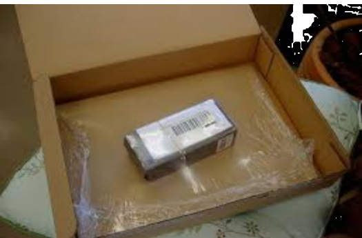
このような状態で商品が届きます

皆様はインターネットショッピングで品物を買ったことがあるでしょうか？欲しいものを検索して、ポチっとすると、最速明日には手元に商品が届くというところで、大変便利な世の中になりました。利用者もここ数年で急激に増えていきます。利用し