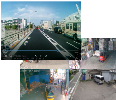
ドライブレコーダーと防犯カメラの映像

生資源の需要と循環を一緒に考えていく必要があると思う。 社内及び周辺を二四時間監視する防犯カメラを取り付けています。 当社では、不法投棄の防止と防犯のために会社の構内及び周辺を監視する防犯カメラを設置しています。夜間は赤外線により白黒になります。近年は街角に防犯カメラが多く設置されていますが、当社も付近で何かあった場合には、ご協力出来ると考えています。 また、当社のトラックは全車両ドライブレコーダーを装備しています。